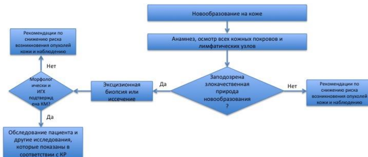
Блок-схема 1. Диагностика и лечение пациента с подозрением на опухоль кожи (КМ)